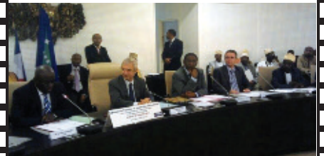
Signature d'un accord de coopération entre le Département et la Grande Comore au Conseil général.