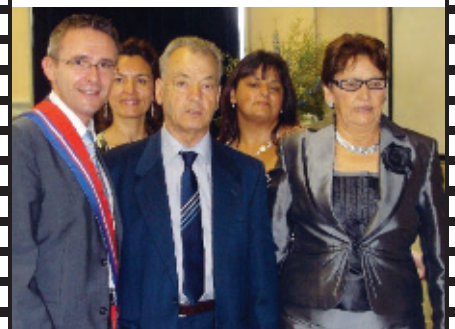
Noces d'Or à La Courneuve.