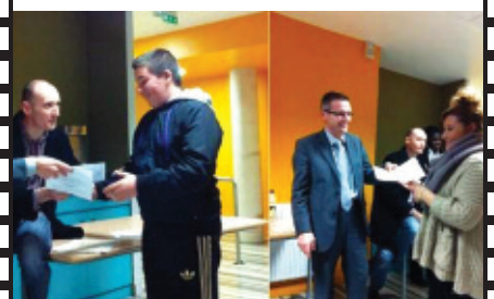
Remise du Diplôme national du Brevet aux ex-collégiens de Poincaré.