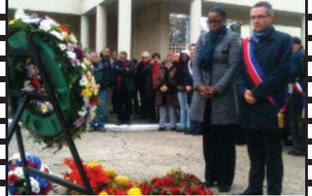
Commémoration du 11 novembre à La Courneuve.