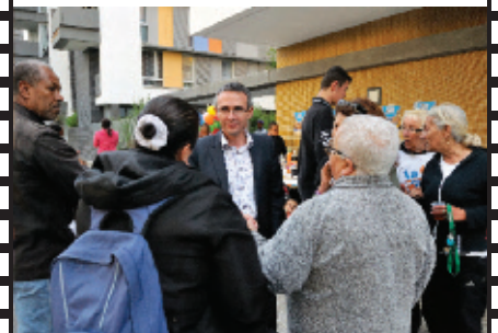
Avec les locataires lors de la Fête des Voisins.